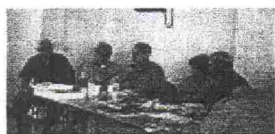
Mesa diretora dos trabalhos