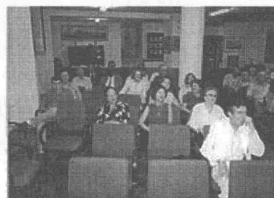
Participantes da AGO