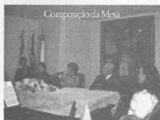
Composição da Mesa