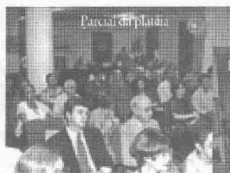
Parcial da plateia