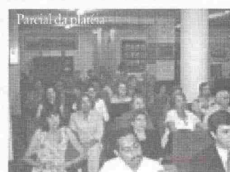
Parcial da plateia