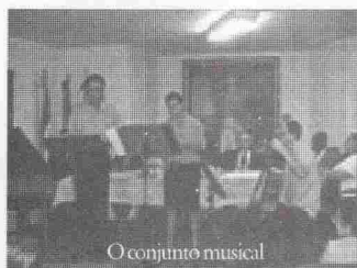
O conjunto musical

Um coquetel fechou, perto das 20 horas, a solenidade do dia 11/06/2003.