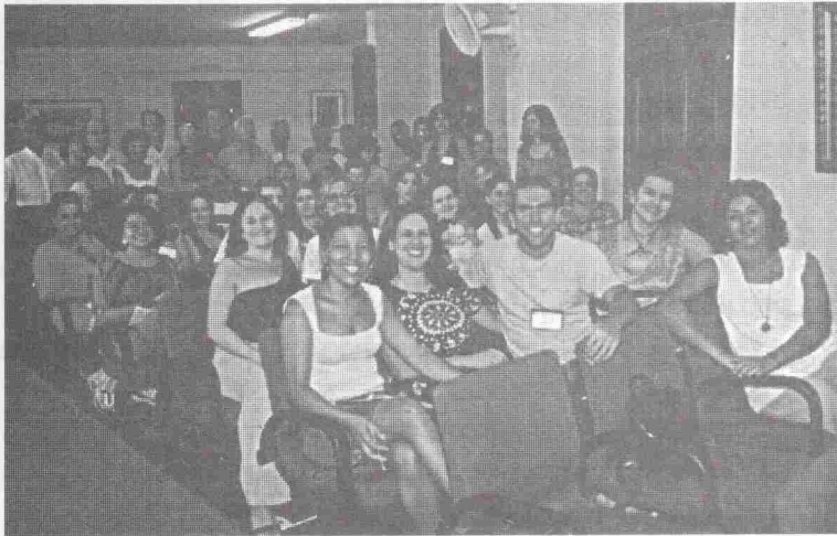
Em primeiro plano, sentados, os cursandos; no fundo, em pé pessoal docente e de apoio.

Uma das contrapartidas que o Instituto houve por bem oferecer à Municipalidade é a conta dos favores do Convênio assinado com a Prefeitura Municipal de Vitória e que tem garantido a manutenção do IHGES, é a da realização de pelo menos 2 Cursos de Extensão durante o ano, voltados precipuamente para professores da Rede de Ensino Municipal. Assim, realizamos o 1º Curso de Extensão no ano passado, no qual houve apenas dois contatos com os cursandos, o primeiro quando da sua instituição, para a fixação de seus objetivos - produção de projetos relacionados com o tema proposto - e outro quando da apresentação dos referidos projetos, que foram divulgadas na Revista nº 56 do IHGES.