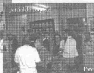
parcial do coquetel