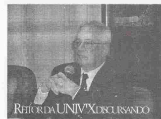
REITOR DA UNIVIX DISCURSANDO