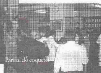
Parcial do coquetel