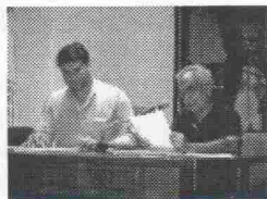
O Secretário Adjunto lendo o Relatório Anual de Atividades