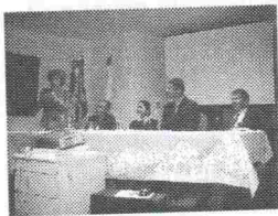
Mesa dos Trabalhos

No dia 13 de junho foi realizada a Assembléia Geral Extraordinária para comemorar o dia do patrono da Casa, Domingos José Martins e a passagem dos 91 anos do IHGES.