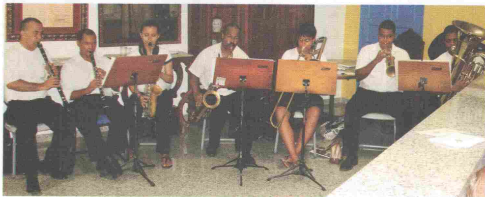
Grupo de Metais da FAMES.