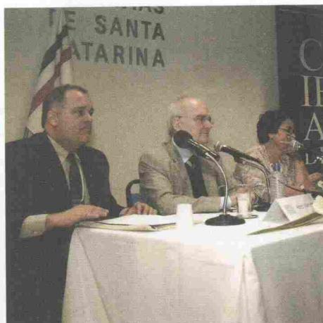
O presidente do IHGES, o presidente do IHGB e a presidente da Academia Portuguesa da História.

Durante os trabalhos o presidente do IHGES proferiu, no dia 8 de Setembro, a comunicação "O IHGES na escrita da História do Estado do Espírito Santo", que revista e aumentada, foi publicada como artigo no n.º 63 da Revista do IHGES .