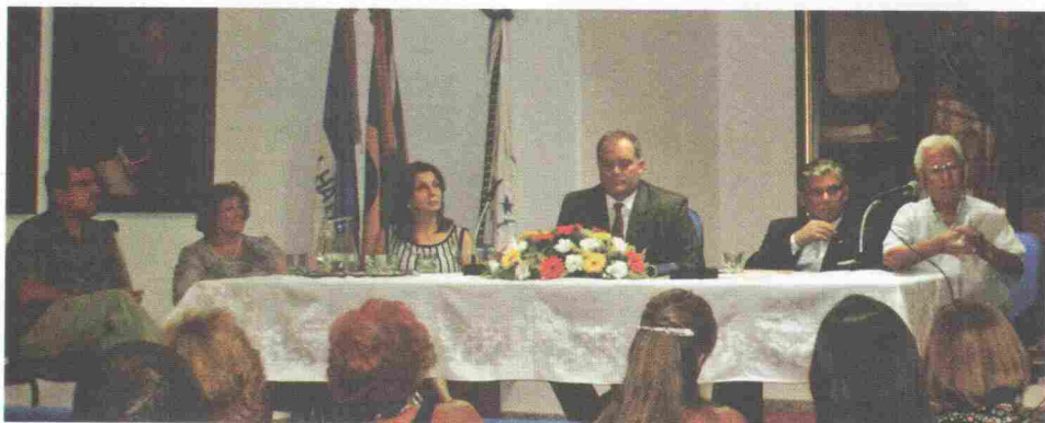
Mesa que conduziu os trabalhos.

No dia 16 de Dezembro realizou-se, no auditório Renato Pacheco, a Dezembrada/2009, para encerramento das atividades do IHGES no ano.