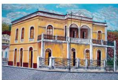
Instituto Histórico e Geográfico do Espírito Santo

Ainda na sessão solene foi lançado o n.º 65 da Revista do IHGES , um número especial, composto em 1949, que não chegou a ser publicado na ocasião.